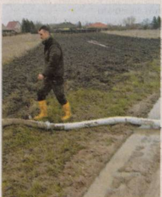
Vízben állnak a földek

Lapunk információi szerint, ha több televíziókészüléken egyidejűleg különböző műsorokat szeretnénk megjeleníteni, akkor több dekóder szükséges. A vétel minősége ráadásul függ az időjárási viszonyoktól és a vételi környezettől is: a nagyobb páratartalom növeli a rádióhullámok csillapítását, ezáltal csökkenti az antennára jutó télerősséget. Szeles időben a vevőantenna környékén található fák lombjainak mozgása változó módon takarhatja ki az antennát. Ezek a jelenségek különösen a vételi határon zavarhatják a vételt. KM