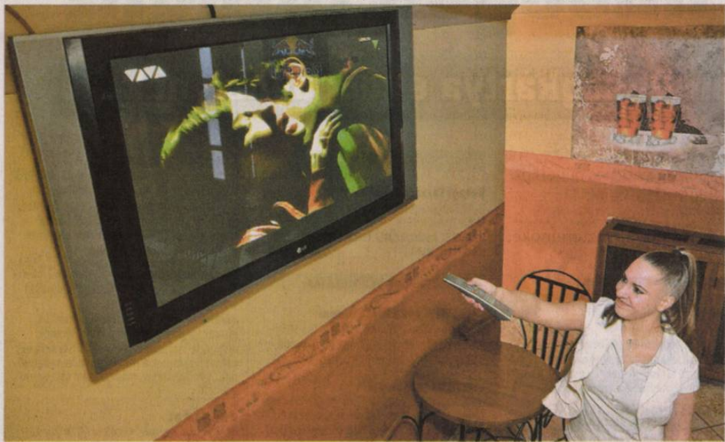
Lesz lehetőség válogatni a csatornák között

- A lényeg: csak és kizárólag azokat érinti a digitális átállás, akik hagyományos, analóg